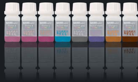
Colour Liquid Prettau® Aquarell Intensiv

Disponibili in flaconi da 20 ml; ideali per Zirconia Prettau®