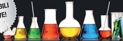
Colour Liquid Aquarell Bio-Pigment

Disponibili in flaconi da 10 ml, in set o singolarmente