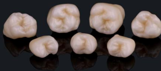
Risultato del lavoro dopo la sinterizzazione