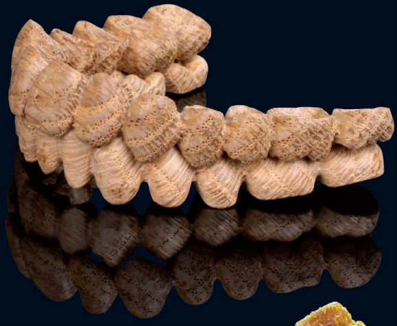
Eiche, veredelt mit Bienenwachs