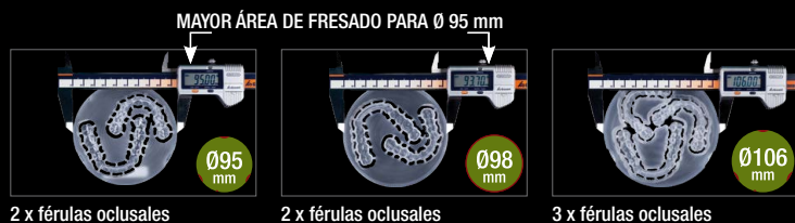
2 x férulas oclusales