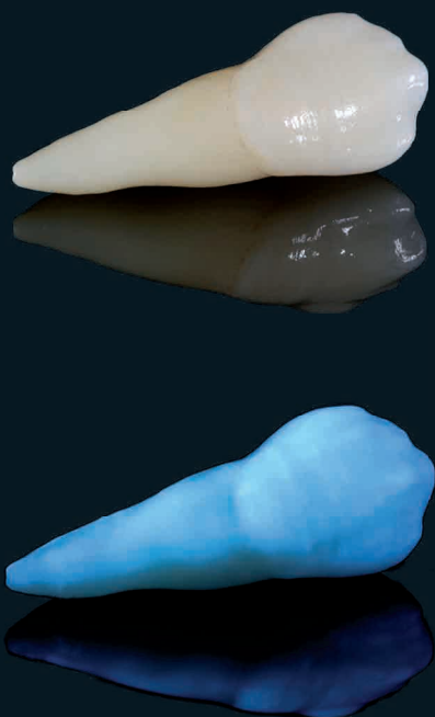
DENTE EM ZIRCONIA PRETTAU® 2 COM GLAZE FLUO