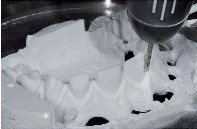
Abb. 5: Fräsvorgang

Zur optimalen Passung werden die Schraubkanäle bei der Einprobe am Patienten mit Dura Lay perfektioniert. Nach Montage von Gerüst und passendem Zirkonrohling im Zirkographen können wir mit Fräsen loslegen.