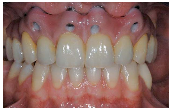
Abb. 23: 13 und 23 zementiert