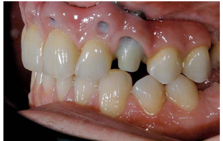
Abb. 22: Arbeit in Situ verschraubt

In der Konstruktionsansicht erkennen wir die Komplexität der gestellten Aufgabe und deren überzeugende Lösung.