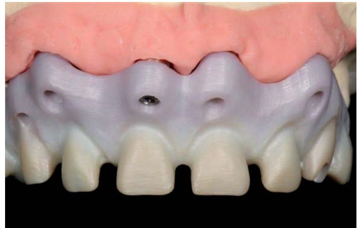
Abb. 8: Und auf dem Modell

Mit Spannung öffnen wir am Morgen den Sinterofen und entnehmen das schillernde, handwarme Gerüst. Je nach Hornhautschicht der Finger bietet der Begriff „handwarm“ hierbei eine große Bandbreite.