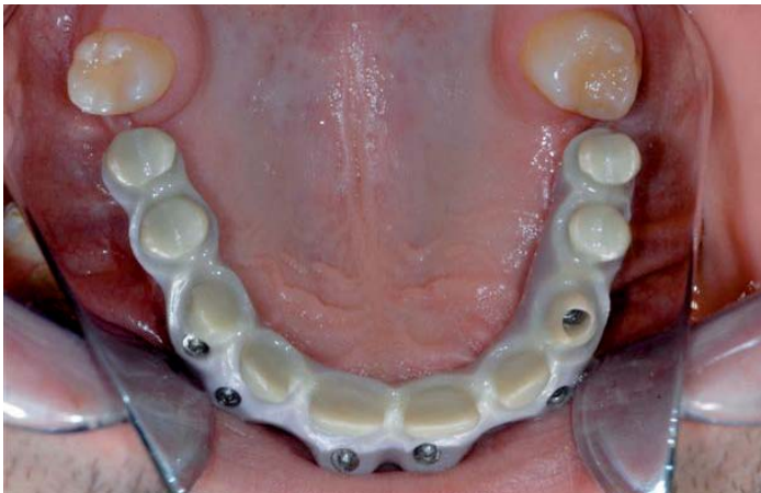
Abb. 10: Occlusale Gerüstansicht

Vor der zeitaufwändigen, keramischen Schichtung erfolgt eine weitere Einprobe am Patienten. Für höchste Präzision empfiehlt sich eine neuerliche Bißnahme, am besten mit festem Material, da Wachs leicht verformbar ist. Auch eine erneute Abformung vom Gegenkiefer kann zur Präzisionssteigerung beitragen.