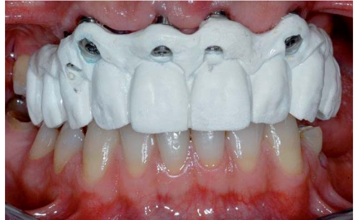
Abb. 3: Framegerüst bei der Anprobe

Konfektionszähne wurden auf dem Meistermodell auf einer Basisplatte aus lichthärtendem Kunststoff ideale aufgestellt, wobei Lage und Stellung der Implantate zweitrangig beachtet wurden.