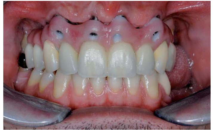
Abb. 15: Rohbrandeinprobe

Wir überlassen nichts dem Zufall und probieren unsere Arbeit vor dem Glanzbrand am Patienten ein. Ästhetik und Funktion können ein letztes Mal überprüft und ggf. korrigiert werden.