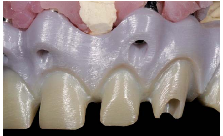
Abb. 11: Schraubkanäle

Mit Spannung öffnen wir am Morgen den Sinterofen und entnehmen das schillernde, handwarme Gerüst. Je nach Hornhautschicht der Finger bietet der Begriff „handwarm“ hierbei eine große Bandbreite.