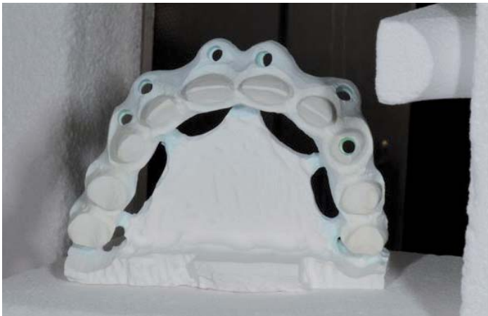
Abb. 6: Zum Sintern bereites, eingefärbtes Gerüst

Nach sorgfältiger Glättung und finaler Überarbeitung wird der „Grünling“ zweifarbig eingefärbt, unter Infrarotlicht ca. eine Stunde getrocknet und danach über Nacht gesintert.