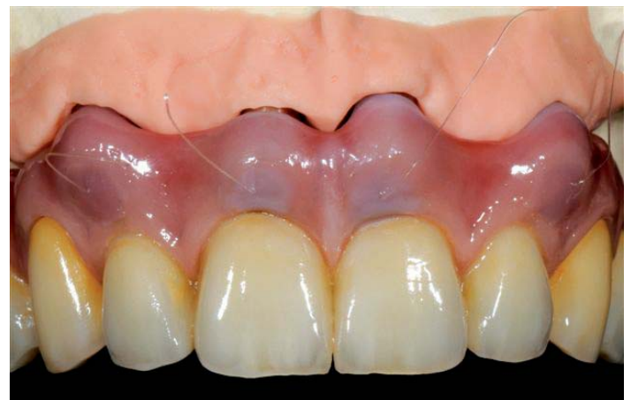
Abb. 17: Front nach Glanzbrand

Dank der gewissenhaften Vorarbeiten können wir die Arbeit ohne weitere Korrekturen fertigstellen.