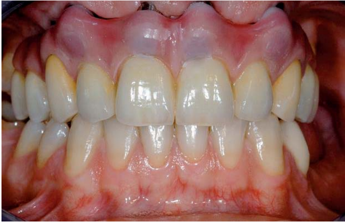
Abb. 24: Schraubzugänge verschlossen

Zum Verschluss der Schraubzugänge fertigen wir Pfropfen aus rosafarbenem Komposit, die mit einem dünnen Nylonfaden bis zur definitiven Befestigung „beweglich“ bleiben.