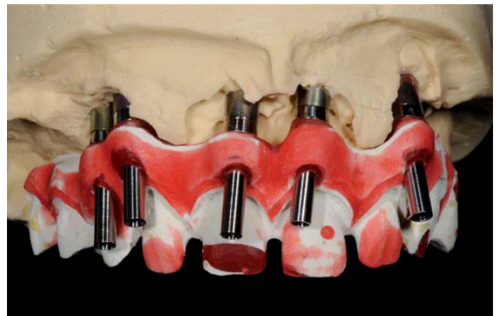
Abb. 4: Schraubkanäle aus Dura Lay

Es sind für alle Zähne individuelle Verblendungen vorgesehen. Hierfür werden die Zähne im Gerüst entsprechend reduziert bzw. präpariert, ebenso der Gingivabereich, der später mit ZZ Tissue Massen anatomisch gestaltet werden soll.