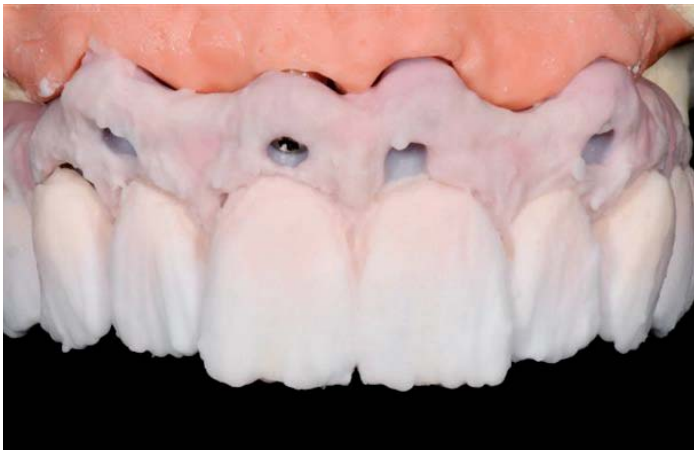
Abb. 14.: Vor dem 1. Brand

Approximale Leisten mit T3 (weißliche Schneidemasse der ICE Keramik) und eine Wechselschichtung von verschiedenen Schneide- und Transpamassen aus dem reichhaltigen Sortiment ergänzen die Zahnform.