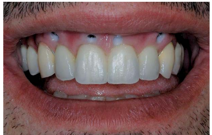
Abb. 16.: Bereits im Rohzustand erkennbar gelungene Ästhetik

Dank der gewissenhaften Vorarbeiten können wir die Arbeit ohne weitere Korrekturen fertigstellen.