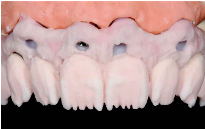
Abb. 13: Leisten T3 und TISSUE

Approximale Leisten mit T3 (weißliche Schneidemasse der ICE Keramik) und eine Wechselschichtung von verschiedenen Schneide- und Transpamassen aus dem reichhaltigen Sortiment ergänzen die Zahnform.