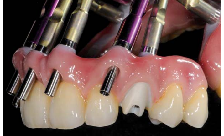
Abb. 21: Konstruktionsansicht