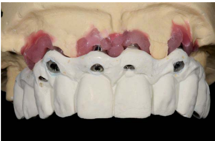
Abb. 2: Framegerüst nach Dublierung der Aufstellung mit Prothesenzähnen

Ausgeprägte Prognathie und ein bescheidener Zustand des Parodontiums ließen keine Wahl-Extraktion und anschließende Versorgung mit Implantaten waren die Lösung. Angesichts der fantastischen Möglichkeiten von Zirkonzahn konnte eine Versorgung erarbeitet werden, die in Ästhetik und Funktion absolut überzeugt.