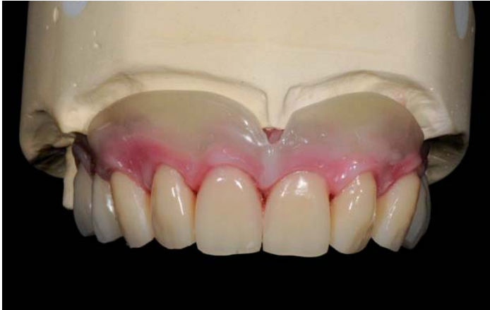
Abb. 1: Aufgestellte Konfektions-Zähne weisen den Weg

Ausgeprägte Prognathie und ein bescheidener Zustand des Parodontiums ließen keine Wahl-Extraktion und anschließende Versorgung mit Implantaten waren die Lösung. Angesichts der fantastischen Möglichkeiten von Zirkonzahn konnte eine Versorgung erarbeitet werden, die in Ästhetik und Funktion absolut überzeugt.