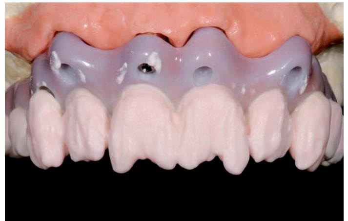
Abb. 12: Dentinaufbau

Die Schraubkanäle der Implantatversorgung liegen durch den prognathen Kieferverkauf bei 12-22 im Vestibulum und im Bereich von 13 und 23 im Kronenbereich. Daher werden die Eckzähne als separate Einzelkronen ausgeführt, die erst nach Verschraubung der Gesamtkonstruktion im Mund des Patienten zementiert werden. Eine Vielzahl an Keramik- und Tissue-Massen lädt nun zur Gestaltung naturgetreuer Zähne und Zahnfleischpartien ein.