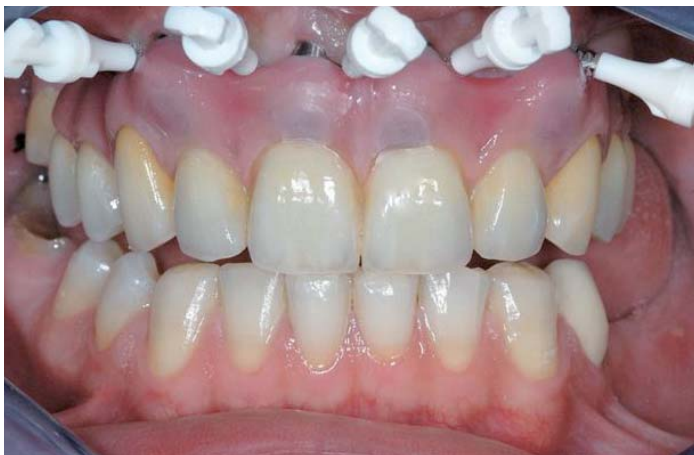
Abb. 20: Anschaulich Darstellung der Reinigungsmöglichkeiten