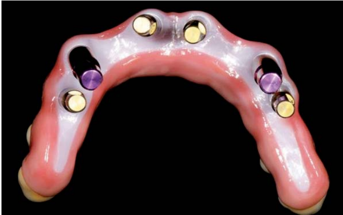
Abb. 18: Basisansicht