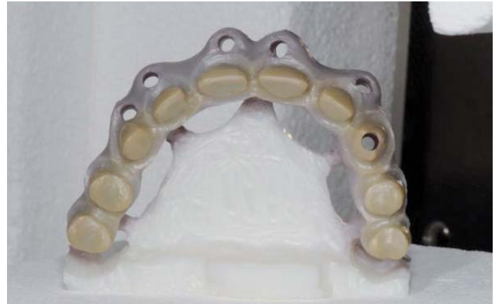
Abb. 7: Gerüst, ofenfrisch nach dem Sintern

Damit sich derartige große Brücken beim Sinterprozess nicht verformen, dürfen Sockel und Verbinder nicht entfernt werden und sie müssen in senkrechter Aufstellung im Ofen platziert werden.