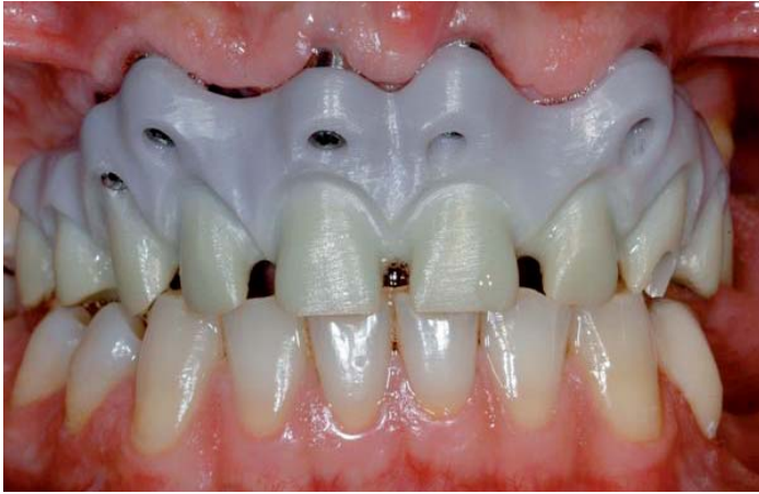
Abb. 9: Zirkongerüst in Situ

Wenn Zirkongerüste einmal passen, dann bleibt das so, auch nach fünf oder noch mehr Keramikbränden!