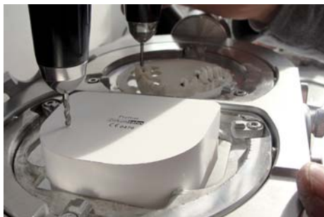
Илл. 5 / 6

Перед тем как начать фрезерование была изготовлена шайба для фиксации объекта. Для того, чтобы добиться идеальной точности работа была зафиксирована на модели Иллюстрация 6. Так как это является неотъемлемой частью для получения сверх точных результатов.