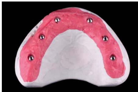
Илл. 1 / 2

Постановка зубов была выполнена из натуральных зубов. При этом была добавлена индивидуальность. Так как направление имплантатов 12, 22 имели излишний вестибулярный