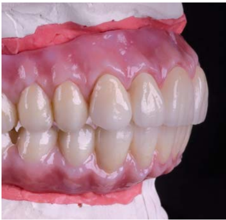
100 % zirconone

В качестве исходной ситуации для удовлетворения пожелания пациента было необходимо провести костную пластику верхней и нижней челюстей. После тщательной подготовки и проведения костной пластики в верхней челюсти были установлены временные имплантаты в виде снепов. После чего были изготовлены временные съёмные протезы как снизу, так и сверху. Целью этого являлось определения прикуса, выявление потребности пациента, а также это являлось основой для дальнейшего протезирования. Так как в нижней челюсти имелись собственные зубы (41, 42, 43, 44, 45, 48), которые пациент не согласился заменить на имплантаты, было целесообразно