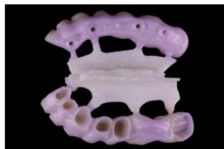
Илл. 11 / 12 / 13