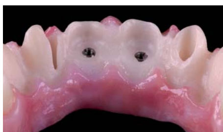
Илл. 16 / 17

Теперь работа завершена, и вся красота, индивидуальность и точность Prettau Zirkon видна во всей красе. Общая картина верхней челюсти не даёт повода предположить, что конструкция сделана из двух частей и является очередным доказательством точности и индивидуальности Prettau Zirkon от фирмы Zirkonzahn.