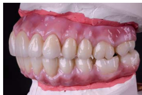
Илл. 20 / 21

Фрезеровалось на ручной системе ZIRKONZAHN.