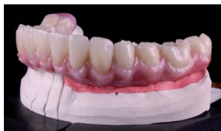
Илл. 18 / 19

Фиксация работы во рту пациента прошла без проблем благодаря тщательной подготовки и аккуратной работы стоматолога и зубного техника .